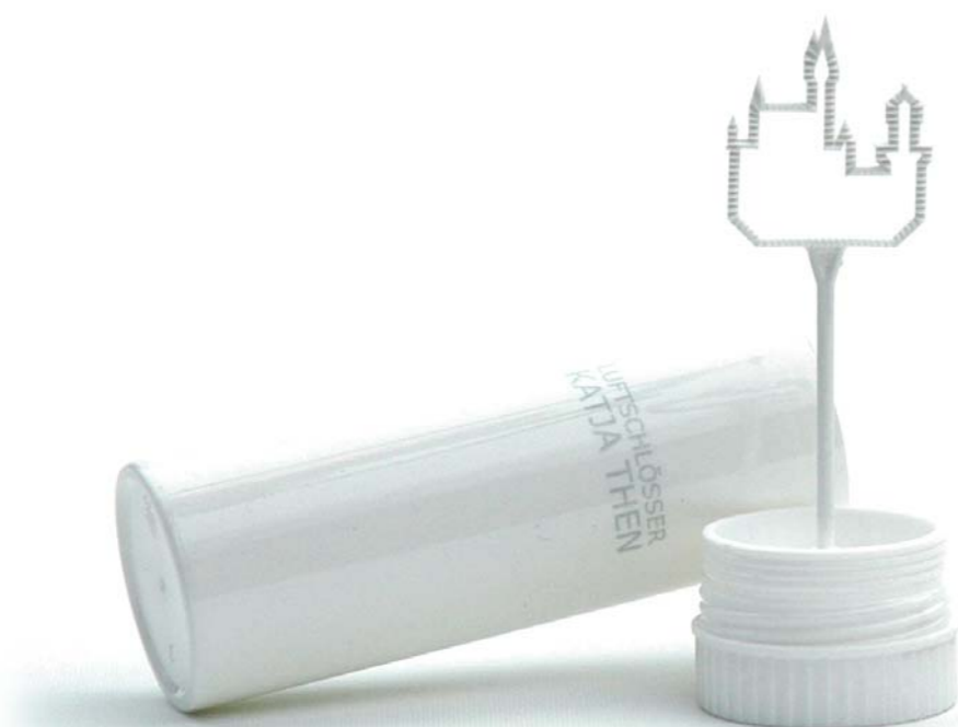
Luftschlösser, 2007, Kunststoff, Seifenlauge